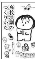
↑いまだにうなるほど 倉庫に眠っている 『高校演劇のつくり かた—日本大学第二 高校の場合—』 Amazonにて絶賛発 売中。256P ¥1,080