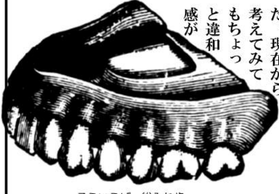
そういえば、総入れ歯

昔 に比べるとずいぶんといろいろなことを思いつかなくなつたなあ、ということをつらつら考えておつた。昔、十年前頃の話で、文藝超人六〇〇とかバトカメとかやつてた頃の話であります。お題に合わせて六〇〇字で即興劇を書く、というコンセプトがあつて、バトカメは当時乱立していた小説投稿サイト對抗戦があつたら面白いだろう、的な狙いがあつた。あの頃は「おらが村が最強だ」ということがモチベーションたり得た。現在から