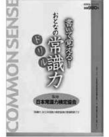
↑ 全テキスト全出題をながしるが手掛けた「書いて覚える！おとなの常識力ドリル」(2007)。今だとAmazonで1円(送料別)で購入可。

ひ ゃんなことから久々に姓名判断をしまして。戸籍名ひどかったよオ、「労多くして儲け少し、友人は得難い。これは一生続く」って。まあ考えてみれば関わった仕事関わった仕事、本当にパツとしなかった。なんか納得してしまつた。昔作つた本も日テレの朝の番組で紹介されたらAmazonのデイリーランキング一位になつたりしたんですが。結果として「トントン」だったそーです。テレビで紹介されなかつたら出血大赤字だったんでしょーか。